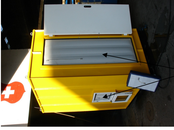
FloodStop - Hochwasser-Schutzkissen

Bei der Systemvorstellung wird ein Demo-Tank (siehe Bild) mit Hochwasserschutz-Kissen versehen und der Tank wird mit Wasser gefüllt.